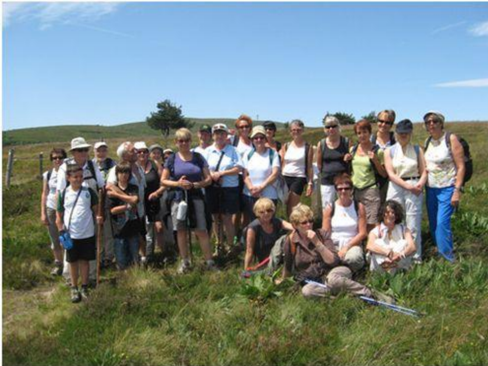
Une autre près de BARD